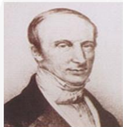
柯西 (Cauchy, A.L. 1789—1857, 法国)