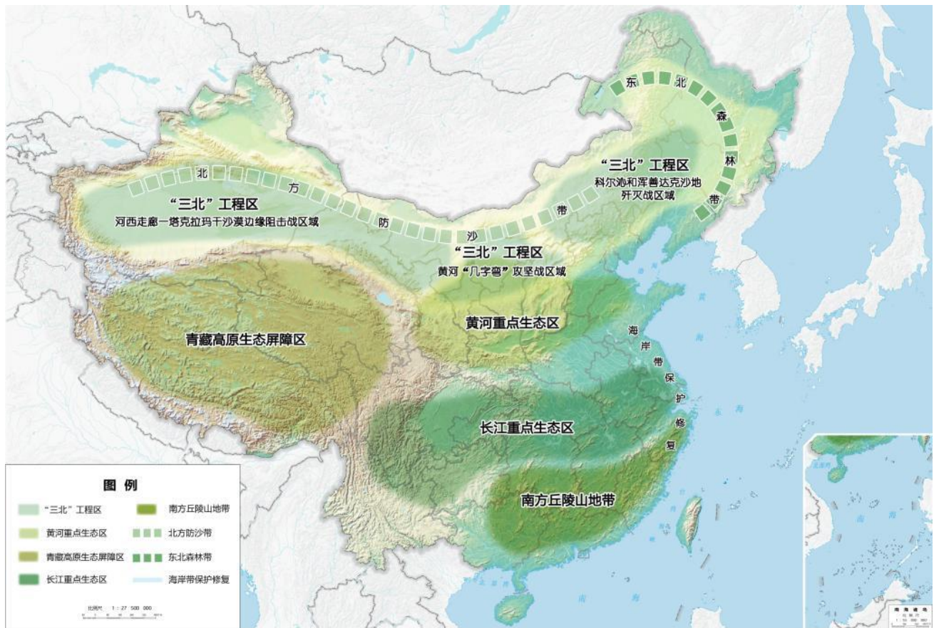
图 3 重要生态系统保护和修复重大工程布局图