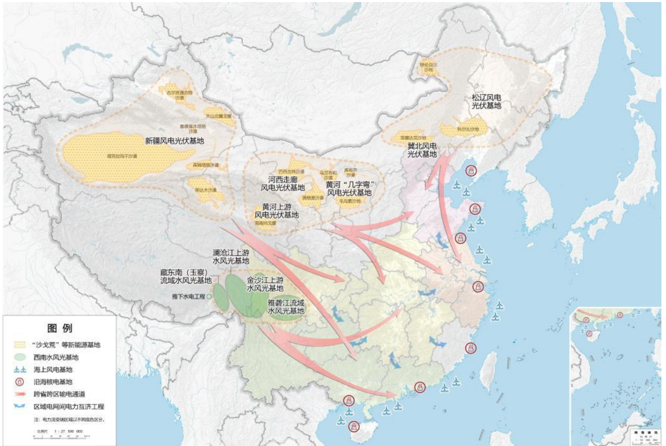
图 1 清洁能源基地布局示意图